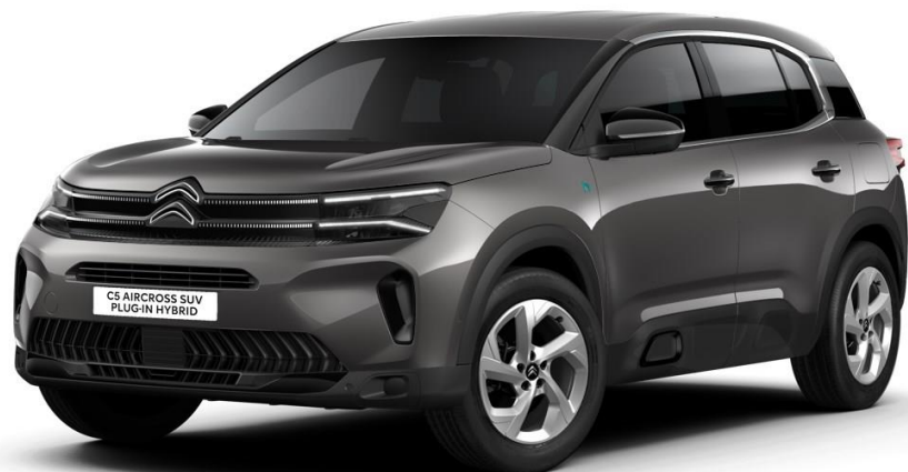
18" lichtmetalen velgen 'Swirl' Standaard op PLUS