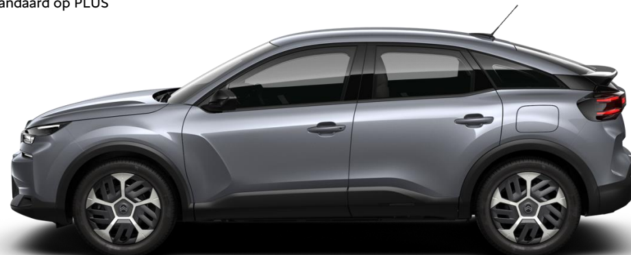
18" stalen velgen 'Aerotech' standaard op PLUS