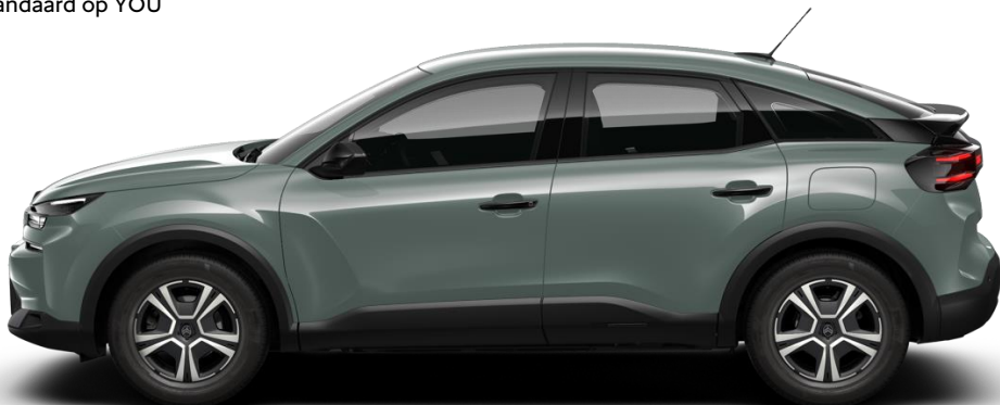
16" stalen velgen met wioldop 'Thor' standaard op YOU