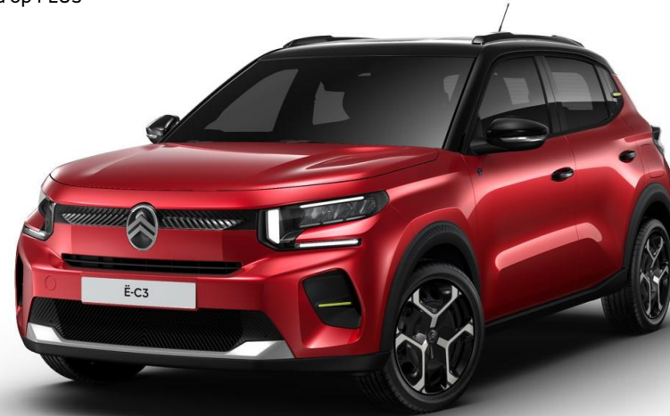
17" stalen velgen met wioldop 'Azurite' Standaard op PLUS