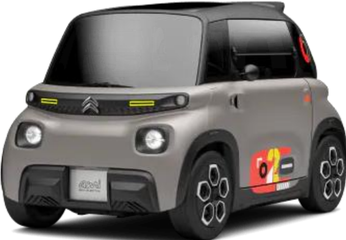
My Ami Peps € 0