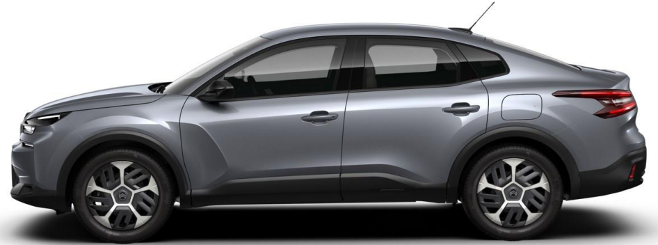
18" stalen velgen 'Aerotech' standaard op PLUS