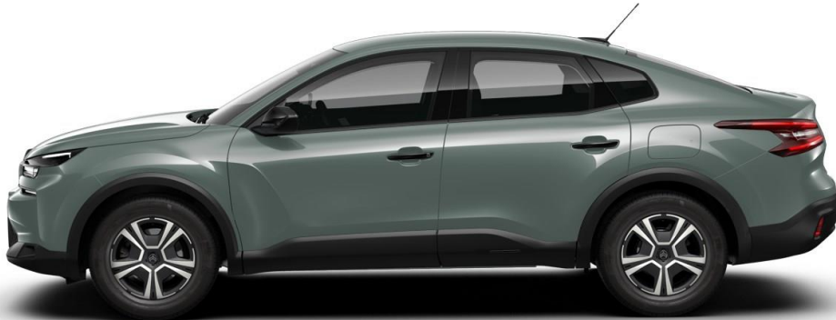
16" stalen velgen met wioldop 'Thor' standaard op YOU