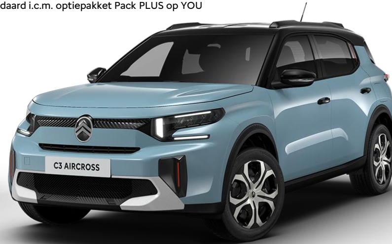
17" stalen velgen 'Sylvanite' Standaard i.c.m. optiepakket Pack PLUS op YOU