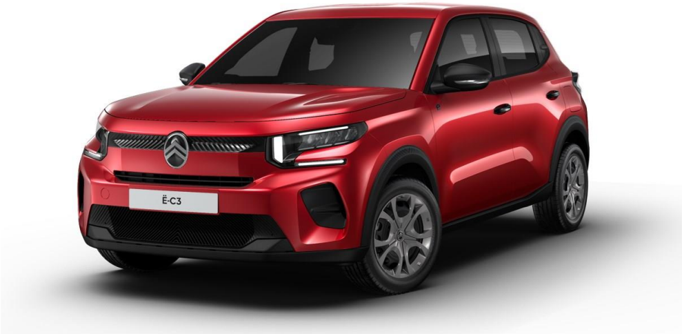
16" stalen velgen met wioldop 'Pyrite' Standaard op YOU