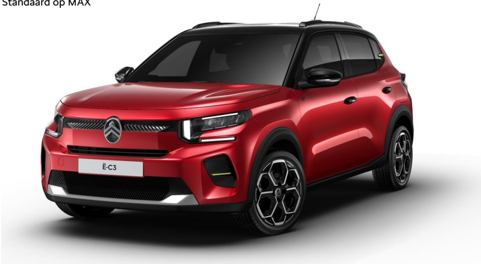
17" lichtmetalen velgen 'Atacamite' Standaard op MAX